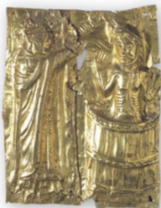
Tamdrup-Tafel mit der Taufe von Harald Blauzahn, The National Museum of Denmark

Dank prachtvoller Leihgaben aus Museen und Sammlungen in ganz Europa (Berlin, Kopenhagen, Krakau, Trier, Lednagora, Mailand, Wien) kann der Besucher eine Reise ins Mittelalter unternehmen, die ihren besonderen Reiz aus der Verbindung von Chroniktext und Ausstellungsobjekt bezieht.