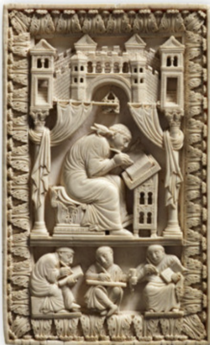
Heiliger Gregor mit Schreibern, Kunsthistorisches Museum Wien

Thietmar entstammte der Familie der Grafen von Walbeck. Seine Ausbildung erhielt er im Stift Quedlinburg sowie an der Magdeburger Domschule. Nach 1004 gewann er schnell das Vertrauen des Magdeburger Erzbischofs Tagino und suchte die Nähe zu König Heinrich II. Es war Taginos Einfluss zu verdanken, dass Thietmar 1009 Merseburger Bischof wurde. 1012 begann er mit der Niederschrift seiner Chronik, an der er bis zu seinem Tode schrieb. 1015 legte Thietmar die Grundsteine zum Neubau des Merseburger Doms.