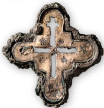
Pektorale Museum of the First Piastas at Lednica, Foto: Mariola Józwickowska

Die Ausstellung bietet einen Gang durch die Chronik und geht dabei auf die Wesensmerkmale dieses mittelalterlichen Lebenswerks ein: die Entstehung des christlichen Europa, die Kraft der Memoria und die Bedeutung der Tugenden für das mittelalterliche Menschenbild.