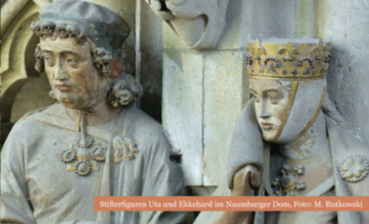
Stifterfiguren Uta und Ekkehard im Naumburger Dom