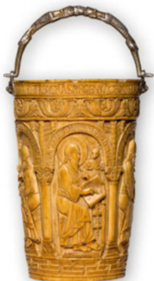
Situla (Weilwassereimer) zum Einzug Ottos II. in Mailand, Museo del Duomo - Duomo di Milano, Foto: Veneranda Fabbrica del Duomo di Milano