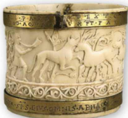
Pyxis mit Jagddarstellung, Bayerisches Nationalmuseum

Geschicht webt Thietmar immer wieder alltägliche Szenen, wie Gefahren durch wilde Tiere, Hungersnöte, Reisen mit dem Schiff, Sitten und Gebräuche verschiedener Völker, aber auch Geistererscheinungen, Sonnenfinsternisse und Traumbilder ein.